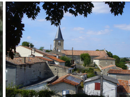
1- L'église vue du tertre du château