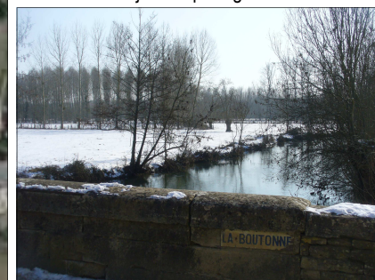
4- Rare vue de La Boutonne depuis le pont !