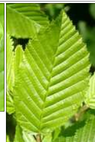
Feuille de charme →