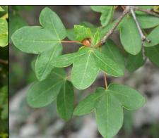
Feuille d'érable de Montpellier ↑