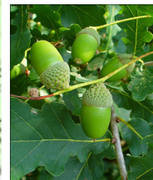
Chêne pédonculé, les glands sont portés par une longue tige (péduncule) .