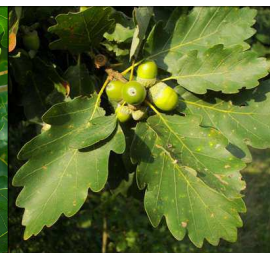
Chêne sessile, les glands n'ont pas de péduncule marqué.