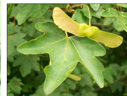
Feuille d'érable champêtre et son fruit (samare) ↑