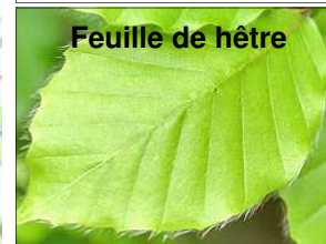
Feuille de hêtre

Cette phrase mnémotechnique permet de distinguer le charme (dont la feuille est dentée (« Adam = à dents ») du hêtre (« être ») dont la feuille est poilue (« à poil »). source: wiktionary