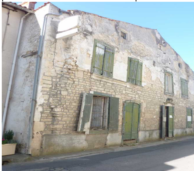
La Croix blanche vue de la rue des Ponts

Vu l'avis favorable à l'incorporation des immeubles dans le domaine privé de l'Etat émis le 29/09/16 par le Directeur des Finances Publiques.