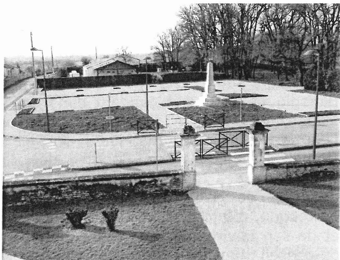
Parking face à la mairie et aux écoles, ouvert au public le 2 février 2015