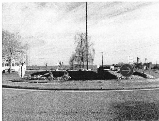
Rond point modifié

D'autres éléments sont à considérer, en particulier le dossier auquel des commerçants réfléchissent : le déplacement de certains commerces vers le rond point (près du garage, lieu de passage plus important).