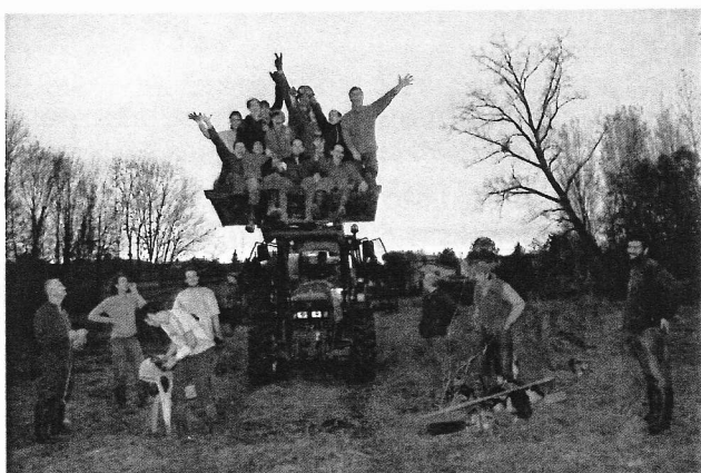
Une participation dans la bonne humeur

Le coût prévisionnel de la première tranche de travaux est présenté aux financeurs pour un montant de 33 000 € HT aidés à hauteur de 22 000 € HT ;