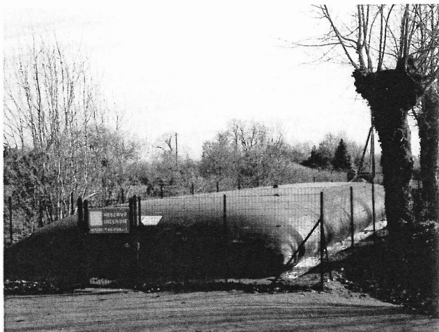
Bâche de 120 m3

L'équipe municipale forme aussi le vœu de mener au mieux les projets qu'elle prépare. Certains ont été lancés durant le précédent mandat sous l'égide de mon prédécesseur et se concrétisent maintenant : parking en face de la mairie ou mise en œuvre de 3 bâches-réserves d'eau pour la lutte contre les incendies par exemple.